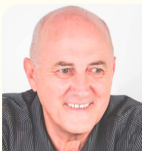
JAVIER BUSTO Hiszpania/Spain

Composer and lecturer born in Vilnius. He studied piano and composition in Julius Juzeliūnas' class at State Academy of Music of Lithuanian SRR in Vilnius. His composing studies he continued in Warsaw Academy of Music in years in Bolesław Woytowicz class. In year 1963 and 1966 he studied Gregorian chant and medieval polyphony in Nadia Boulanger class in Paris. He is a laureate of many prizes and distinctions. His composition “Antifone per tre gruppi d'orchestra” (1961) won 1st prize of Polish Young Composers competition, and in year 1963 he took 2nd place in year 1963 in International Composers meetings of UNESCO in Paris; in year 1966 for his “Sonetti di Petrarca per tenore solo e due cori a cappella” (1965) he received 1st prize at International Composers' Competition in Prague. In year 1965 and 1973 he received 1st prize in International Composers' Competition in Monaco. In year 1994 he received the prize of AGECE – West European Federation of Choral Societies and the prize of Polish Composers Association. In year 2006 he won Paderewski Prize. Since 1971 Romuald Twardowski has been the Professor of Warsaw Academy of Music. He is the jury member of many choir competitions and the Artistic Director of prestigious International Festival of Orthodox Church Music “Hajnowka”. He composed numerous brilliant compositions for choirs, orchestras, soloists and musical ensembles.